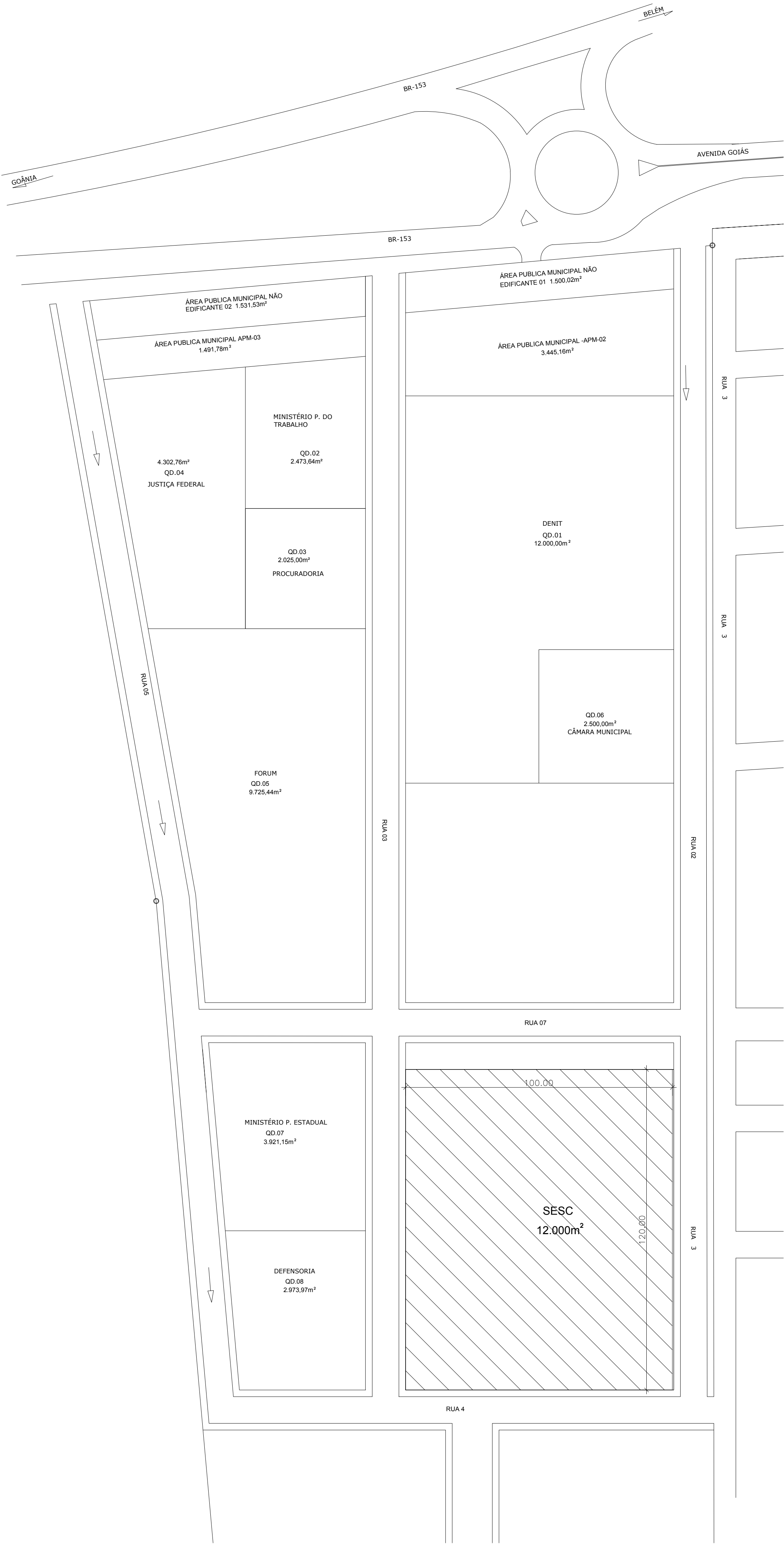
PLANTA DE SITUAÇÃO ESC. 1/1000